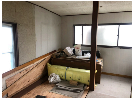
【東村山市多摩湖町空き家 間取図（キッチン・トイレ・洗面台はありません）】